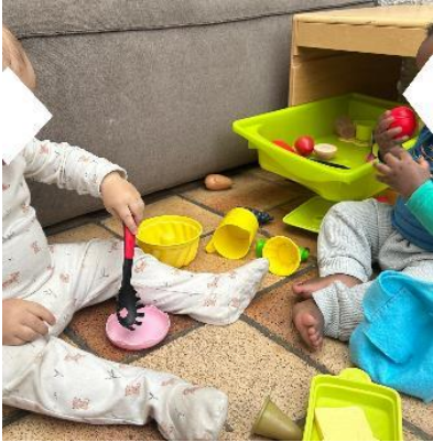
Initiative Dr Mendelbaum

Un projet né pour combler un vide dans le réseau