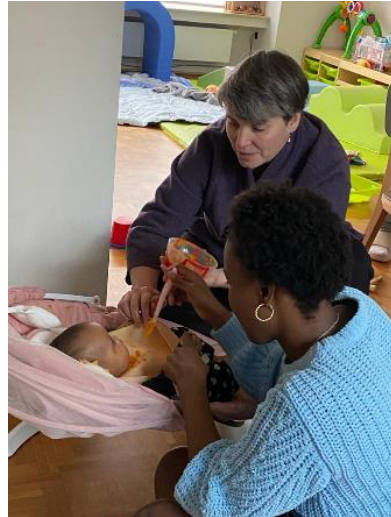
Accueil des mères et des bébés 5 dyades