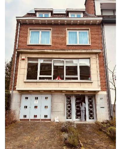
Accompagnement vers une autonomie parentale